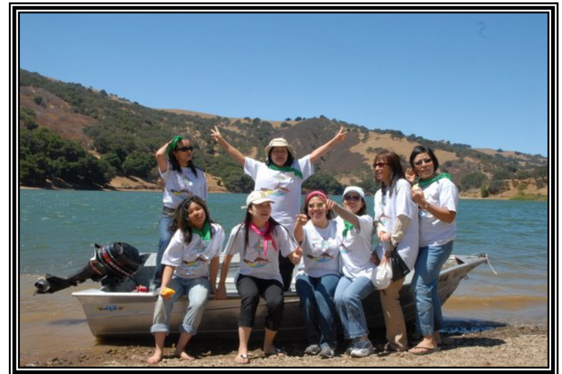
Trại hè Ca Đoàn & GTVB Bay Area Youth Camp & La Vang Choir